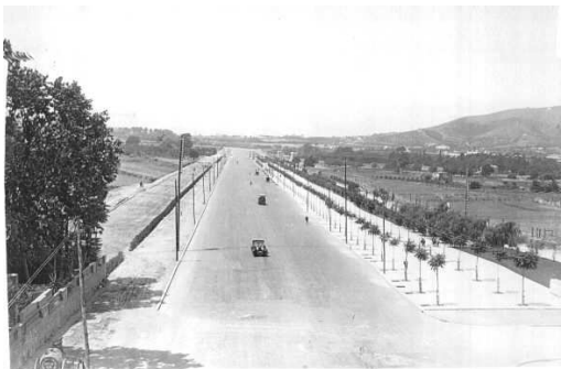
Vista de la futura avinguda de la Diagonal al principi del segle xx, durant l'etapa de la seva urbanització.

Durant la primera meitat del s.XIX , Barcelona experimenta un gran auge mercantil i industrial. La nostra ciutat no podia seguir per gaire temps tancada dins les muralles medievals que encara l'envoltaven i que passaven per l'actual Avda. del Paral.lel i les Rondes calia eixamplar i donar espai vital per a aquell moment d'expansió. El juny de 1854 el govern autoritza l'enderrocament de les muralles . Al cap de cinc anys , l'enginyer Ildefons Cerdà presenta un Pla de Reforma i Eixample per a la nostra ciutat. La burgesia va començar a abandonar els carrers més estrets del casc antic i va optar per establir-se al centre de l'Eixample que tenia com a eix el passeig de Gràcia una de les artèries nobles del pla Cerdà.